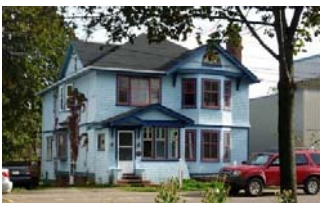
Ferien-Appartements in Charlottetown, PEI