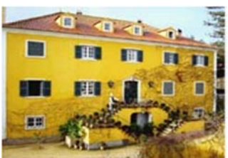
Ferien in Portugal

Das Anwesen Quinta de Sant'Ana liegt in Gradil bei Malveira, im Herzen der Estremadura. Ein historischer Familienbesitz, welcher eigenen Wein sowie Honig, Obst, Gemüse und Holz produziert. Einige der Gebäude sind zu bezaubernden kleinen Ferienhäusern umgebaut und beherbergen Gäste. Wer in kleinem oder größeren Rahmen ein Fest feiern möchte, kann auf der Quinta de Sant'Ana seinen Traum verwirklichen. Es liegt 30 km nördlich von Lissabon und ist vom Lissabonner Flughafen bequem in einer halben Stunde zu erreichen. Mehr Infos und Anmeldung unter: www.quintadesantana.com