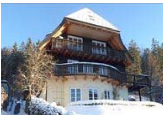
Ferien in Hinterzarten

Sie lieben die Ruhe, die Natur, Wiesen, Wind und das Meer, dann genießen Sie Ihren Urlaub auf Gut Priesholz unweit der Ostsee, bei Gelting/Kappeln, südöstlich von Flensburg. Verwandte Freunde von uns haben in den neben dem Gutshaus gelegenen Gebäuden wunderschöne Ferienwohnungen bzw. Ferienhäuser eingerichtet. Die idyllische Alleinlage des Gutshofs bietet Erholung pur, ob gemütlich allein oder mit Kindern. Die unberührte Natur- und Küstenlandschaft der Region Angeln bietet ländlich geprägte Dörfer, eine hervorragende Wasserqualität und zahlreiche naturbelassene Badestrände. Weiter Infos und Anmeldung unter: http://www.gut-priesholz.de