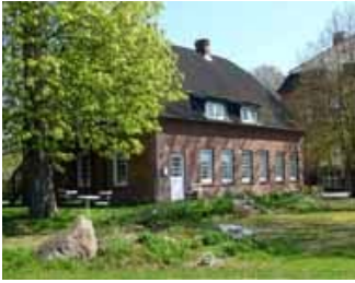
Ferien auf Gut Priesholz