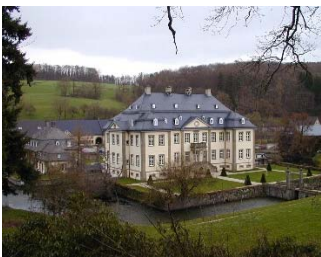
Feiern in Körtlinghausen

Nicht um dort Ferien zu machen, aber zum Feiern von Hochzeiten, Geburtstagen und anderen Jubiläen können wir folgendes Domizil sehr empfehlen: Schloss Körtlinghausen liegt prachtvoll eingebettet im Glennetal zwischen Rüthen und Warstein im Kreis Soest/NRW. Um 1740 angelegt, besteht das Barock-Ensemble aus Schlosshof mit Springbrunnen und privat genutzten Kavalieregebäuden. In den nördlichen Vorgebäuden befinden sich die Verwaltung und die Landwirtschaft. Das Schloss wird als Eventlocation für festliche Veranstaltungen und Tagungen und als Filmlocation vermietet. Siehe mehr Infos bei: https://www.koertlinghausen.de/