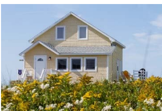
Ferien direkt am Strand